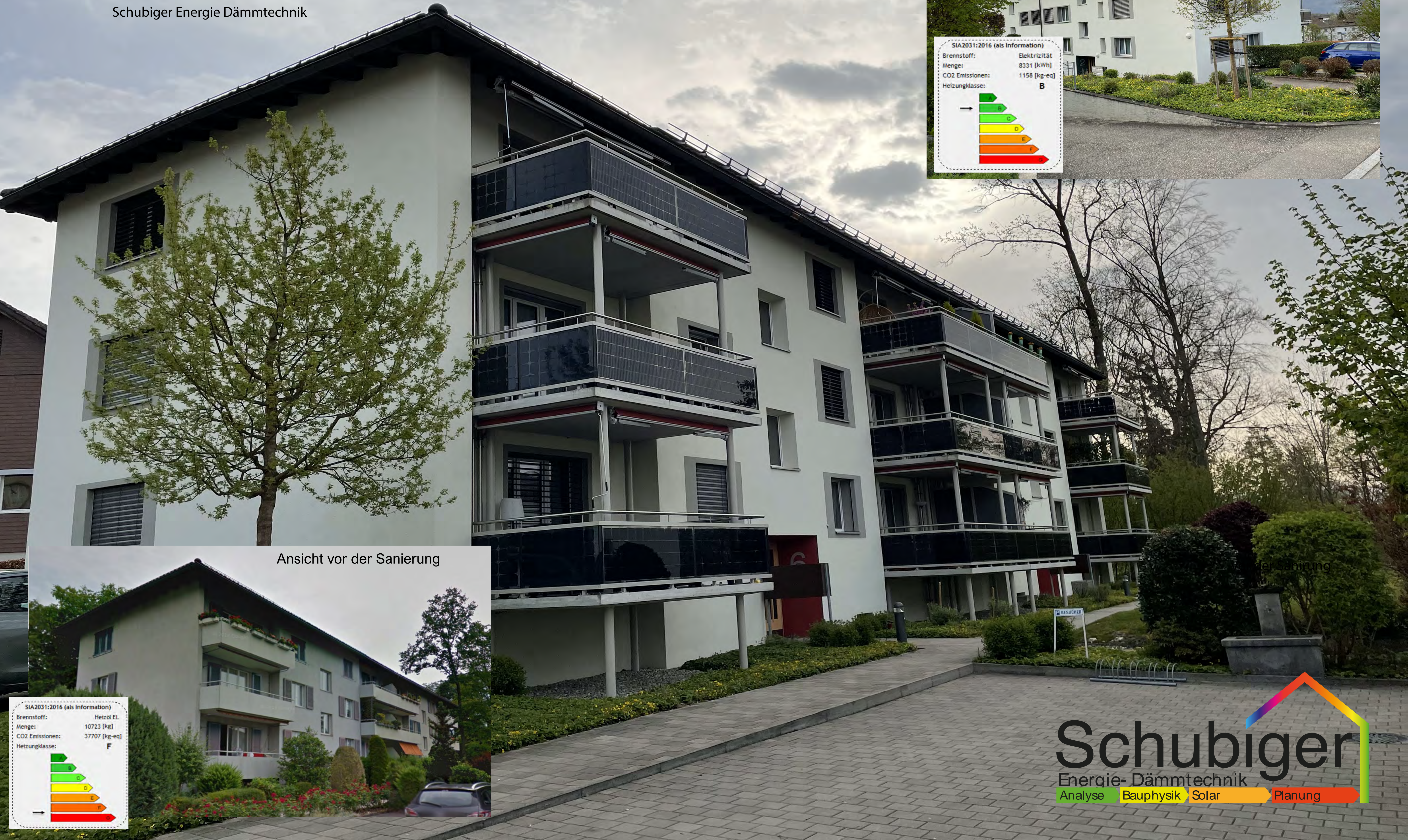
Ansicht vor der Sanierung